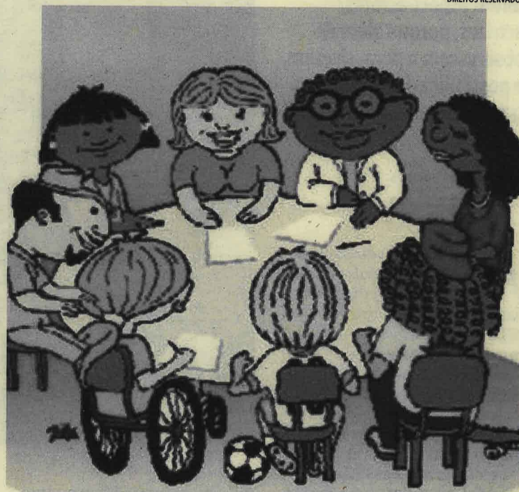
A promoção de estilos de vida saudáveis exige a participação de todos

Estilos de vida saudáveis são um conjunto de hábitos e comportamentos de resposta às situações do dia-a-dia, aprendidos através do processo de socialização e constantemente reinterpretados e testados ao longo do ciclo de vida. A promoção de estilos de vida saudáveis deve ser uma preocupação comum a todos os membros da comunidade educativa: os alunos, os pais, o pessoal docente/não docente os profissionais de saúde, de entre os quais se destacam os enfermeiros, em especial os de saúde comunitária e escolar, dado o seu campo de actuação. Proporcionar às crianças um ambiente escolar saudável potencia a aquisição de estilos de vida saudáveis e, por conseguinte, diminui a prevalência de factores de risco como o tabagismo, o sedentarismo ou erros alimentares, incluindo o abuso de álcool. Por outro lado, a actividade física e a opção por uma alimentação saudável, por exemplo, aumentam a prevalência de factores protectores. Existe, pois, uma inter-relação inegável entre a saúde e a educação, na medida em que a saúde influencia a aprendizagem e a educação influencia a saúde. Como cidadãos de plenos direitos, as crianças são chamadas a fazer parte do processo de planeamento de EPS (Escolas Promotoras de Saúde), como parceiros activos na identificação de problemas, definição de estratégias, selecção das boas práticas e reflexão sobre as melhores alternativas para reforçarem a sua saúde. Do mesmo modo, espe-