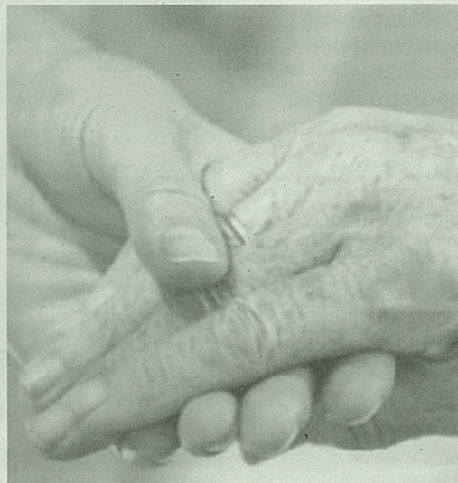
É necessário mais comunidade...