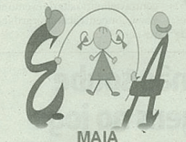
Movimento Amigo dos Idosos Ativos