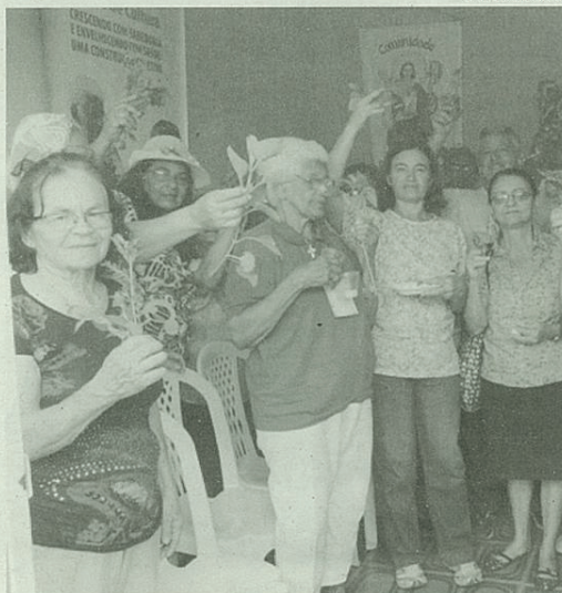
Mais integração, menos exclusão...

Assim, foi possível realizar cinco projetos de intervenção comu-