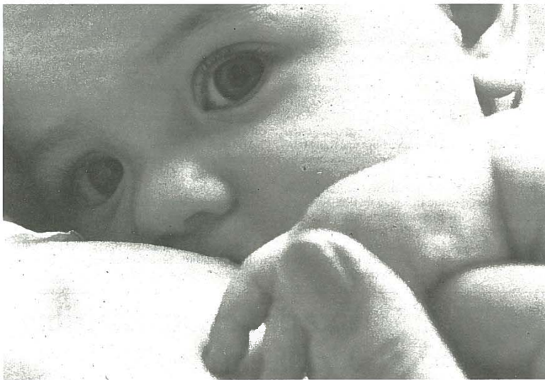
Uma relação para a vida...

As inquietações relacionadas com a prática do AM na RAA, sobretudo as relativas à uniformização da atuação e dos indicadores de avaliação, necessários ao conhecimento do padrão da amamentação e a formação em AM promovida pela OMS/UNICEF, deverão constituir uma prioridade no Serviço Regional de Saúde. Urge alterar e uniformizar práticas tendentes ao aumento das taxas de AM, com base