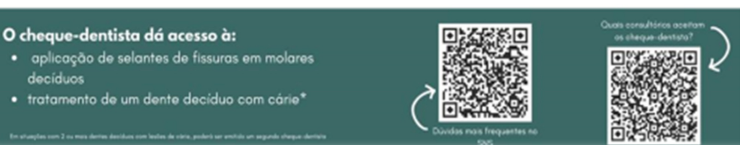
Fig.1 – Material de Apoio (ex: Poster QR Code e régua)