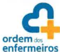
TABELA DE TAXAS/EMOLUMENTOS E QUOTAS