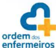
TABELA DE TAXAS/EMOLUMENTOS E QUOTAS