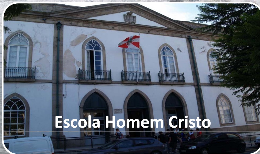
Escola Homem Cristo