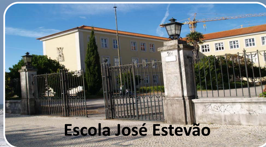
Escola José Estevão