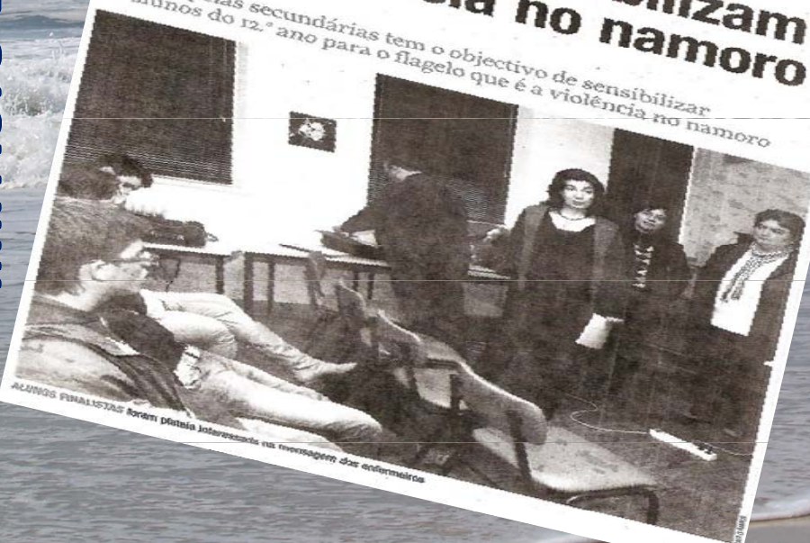
ALUNOS FINALISTAS foram também sensibilizados na mensagem dos enfermeiros

Périplo pelas secundárias tem o objectivo de sensibilizar os alunos do 12.º ano para o flagelo que é a violência no namoro