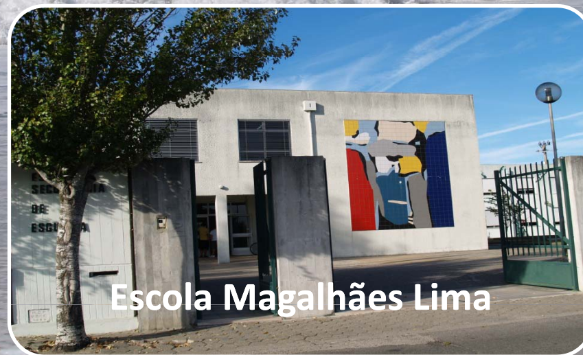
Escola Magalhães Lima