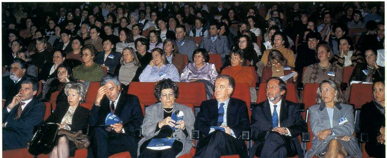
Convidados e congressistas na Sessão Solene de Abertura

Estou convicta de que o fruto deste esforço fará com que o I Congresso da Ordem dos Enfermeiros se torne num marco histórico na enfermagem e na saúde em Portugal!