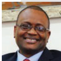
Dela Dovlo Organização Mundial de Saúde, África