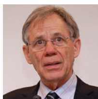
Constantino Sakellarides Presidente da Fundação para a Saúde/SNS. Diretor-geral da Saúde 1997-99. Professor Catedrático Aposentado na Escola Nacional de Saúde Pública