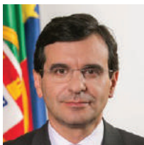
Adalberto Fernandes Ministro da Saúde