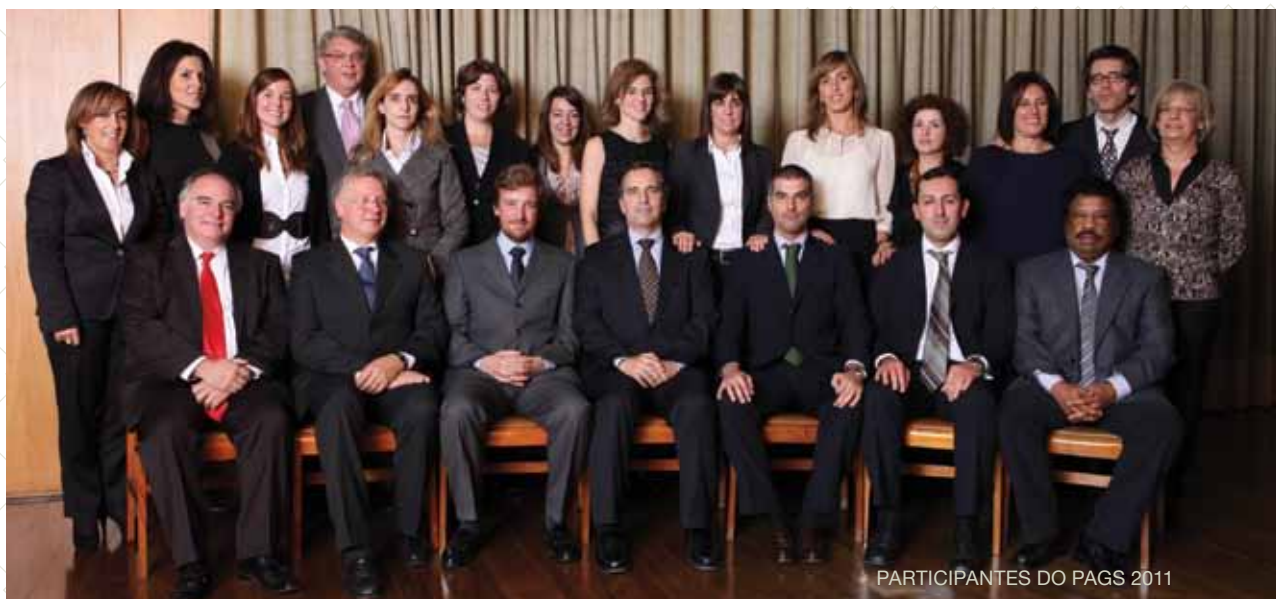
PARTICIPANTES DO PAPS 2011